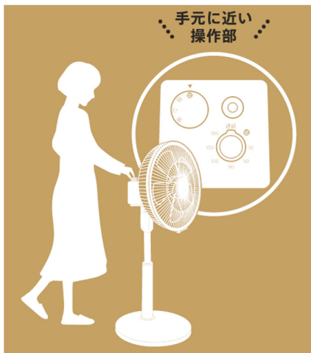
立ったまま楽ちん操作