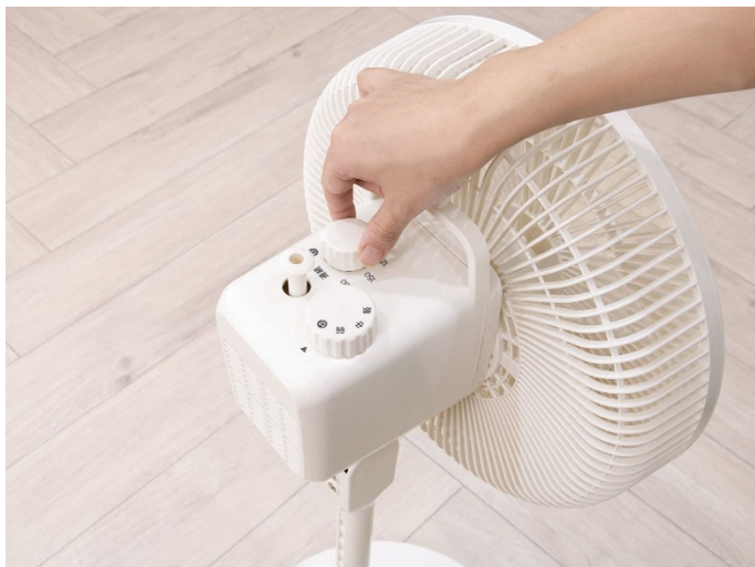
すべての操作が上部でおこなえる「メカリビング扇風機 DL-J31TP」