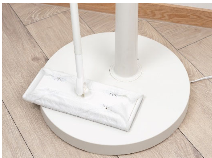
すっきりしたベース部で、お手入れしやすい