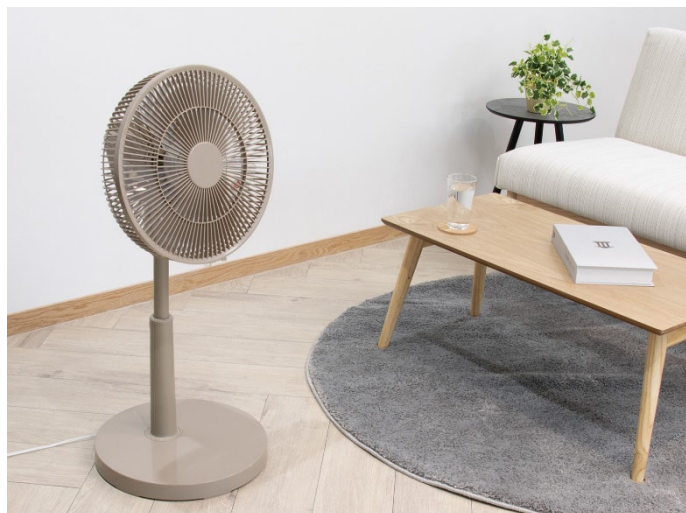
「メカリビング扇風機 DL-J31TP」使用イメージ